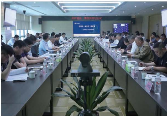
总部安全、技术质量、财务条线领导 分别就一季度重点工作进行汇报

5月18日下午，龙信建设集团召开“控风险、保生存、谋发展”主题的2024年一季度经营层会议。龙信控股公司领导、龙信建设董事监事经营层、分（子）公司/区域公司负责人、总部及一分公司部门经理、房产及专业公司相关人员等共同参会。